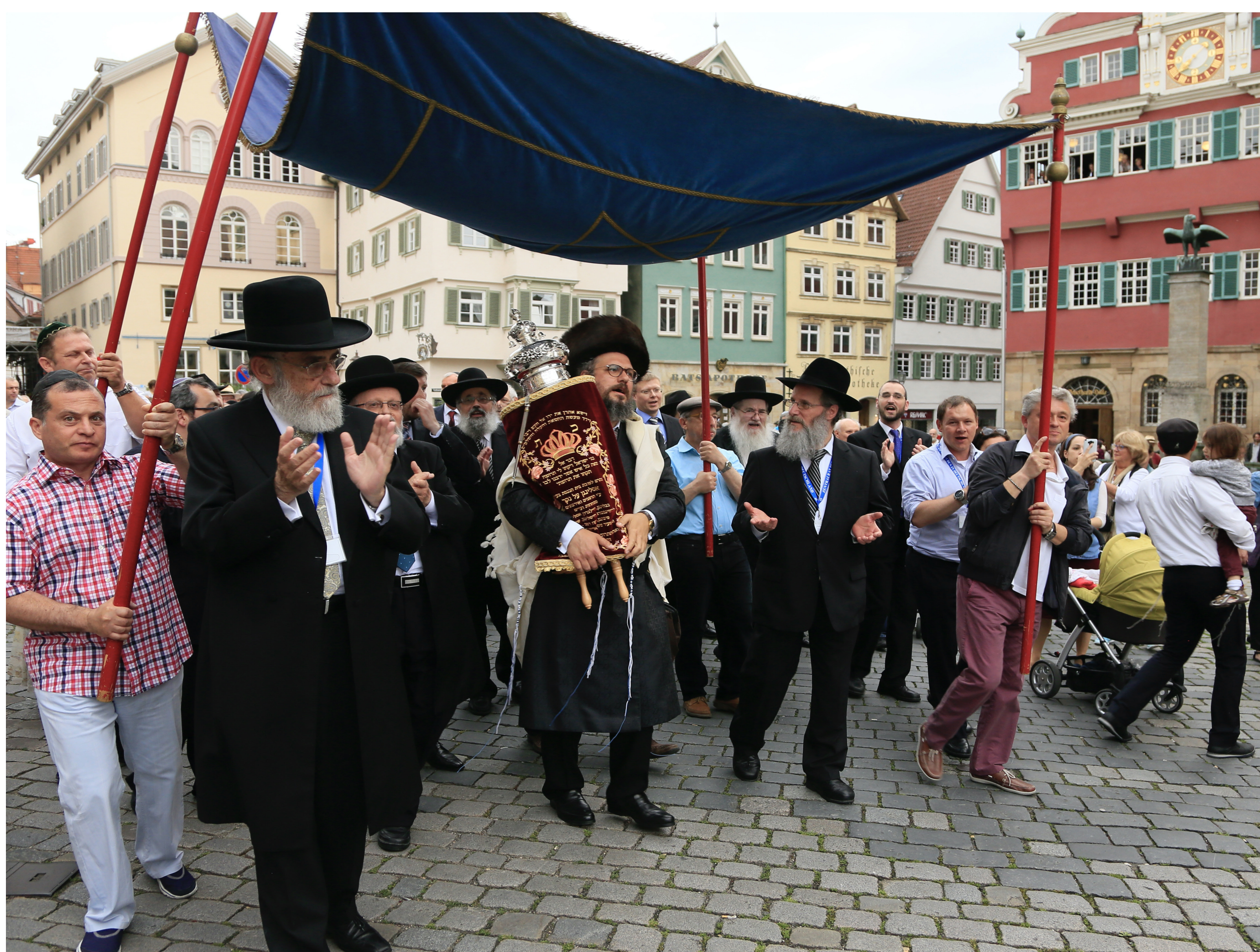
Die neue Esslinger Torarolle wird am 7. Juni 2016 durch die Altstadt zur Synagoge getragen

Wiedereröffnung der Synagoge im Heppächer